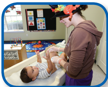
Cómo iniciar una plática De 6 a 12 meses