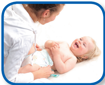
¡Cucú! ¡Aquí estás tú! De 3 a 12 meses