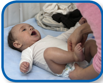
Hora de la rima De 0 a 8 meses