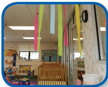
Cintas de colores De 2 a 6 meses